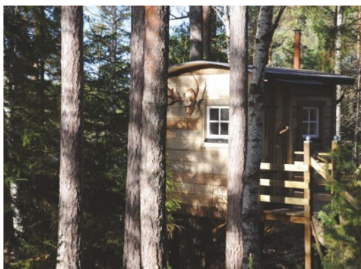
Unterkunft in Nebengebäuden, im Hauptgebäude oder im Baumhotel.