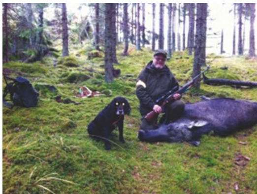
Das Essen kommt direkt aus dem Wald.