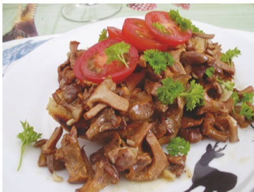
Lassen Sie es sich gut schmecken.